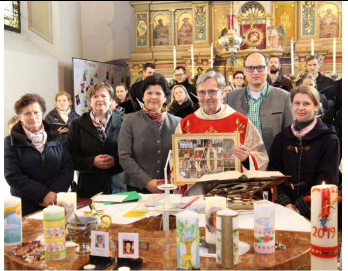
Der Vorstand von Pfarrgemeinde- und Wirtschaftsrat gratuliert