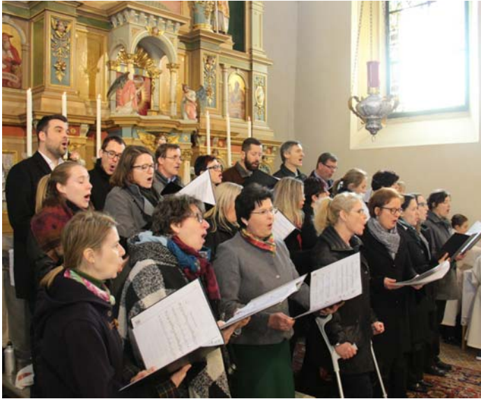
Chor Cantica Nova

Aus diesem Anlass wurde am 2. Februar, zu Maria Lichtmess, ein Festgottesdienst gefeiert.