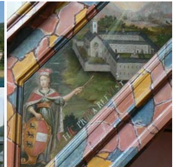
Detail aus dem Kanzelaufgang