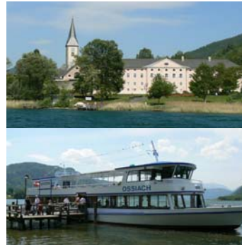
Stift Ossiach Schiffahrt auf dem Ossiachersee

Hinweis: Die Firma Weiss – Autobusunternehmung veranstaltet diese Reise!