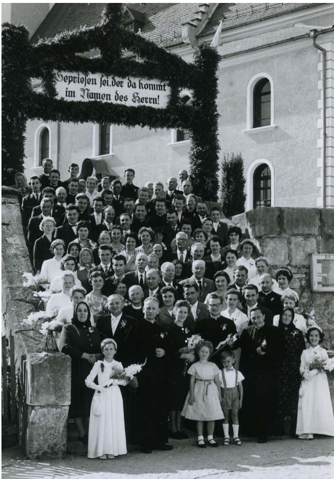
10. Juli 1960: Die Feiernden und der Primizpriester auf der festlich geschmückten Kirchstiege