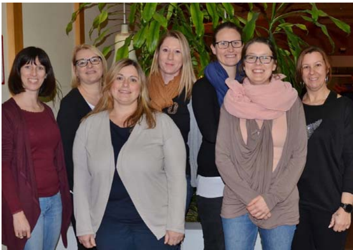
Tischmütter begleiten die Erstkommunionkinder

24 Kinder der Pfarre machen sich in 4 Gruppen auf den Weg, Jesus näher kennen zu lernen. In den Gruppenstunden werden sie erleben, was diese Botschaft Jesu bedeutet und wie wir sie leben können. Herzlicher Dank gilt den Tischmüttern, die sich bereit erklärt haben, Wegbegleiter zu sein.