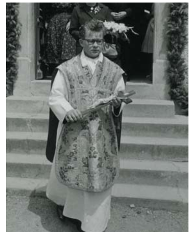
Auszug aus der Kirche