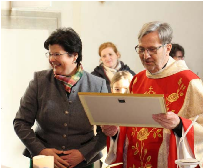
Eine Fotocollage zur Erinnerung

Feierlich umrahmt wurde dieser Gottesdienst vom Kirchenchor, vom Chor Cantica Nova und von einer Bläsergruppe der Pfarrmusikkapelle St. Georgen.