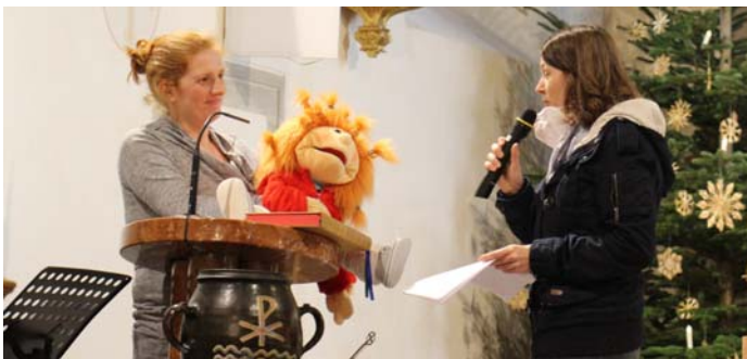
Hannah erfährt die Geschichte Jesu